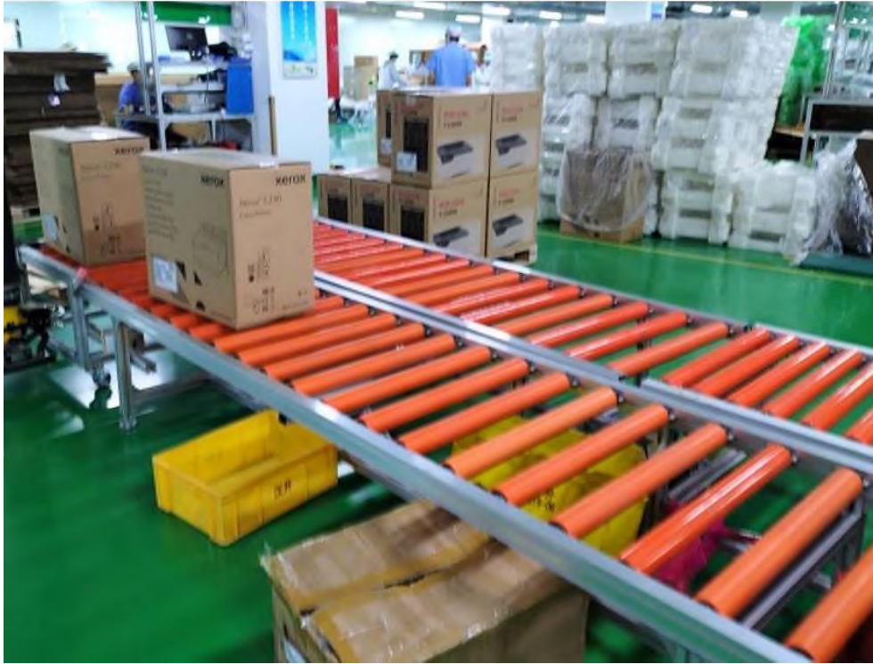
Иллюстративное фото линии упаковки

Питание осуществляется от сети переменного тока 220/380В AC. Максимальное потребление конвейерной линии вместе со всем сопутствующим оборудованием составляет не более 60 кВт. Для монтажа конвейерной линии в полу помещения используется диэлектрический слой и заземление по всей площади поверхности с сопротивлением более 100 кОм. В запрошенных точках будет установлен доступ к электрическому питанию.